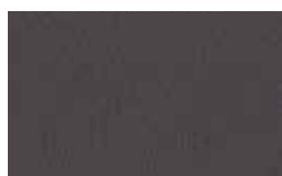
Medium Grey C37 Y2M29I