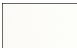
Bianco 16 Y2M35I

Colori solo indicativi. Il prodotto reale potrebbe variare leggermente.