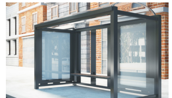
Přístřešky pro autobusové zastávky