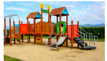
Venkovní nábytek – dětská hřiště