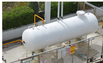
Palivové nádrže LPG