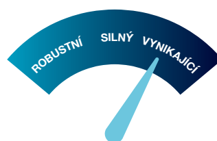
OCHRANA PROTI KOROZI

Katodická ochrana je metoda používaná k řízení koroze kovu tím, že se stává katodou elektrochemického článku. To znamená spojení kovu s reaktivnějším „obětním kovem“, který koroduje místo chráněného podkladu.