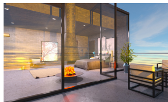
Ocelové okenní rámy