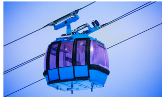
Lanovky a sedačkové lanovky